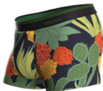
DESERT BLOOM DARK NAVY