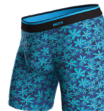
FLOWER POWER ROYAL