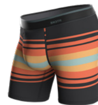
SUNDAY STRIPE BLACK