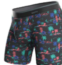
SAIL AWAY MULTI