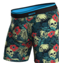
JUNGLE SKULL 24 MULTI