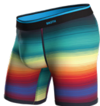
RHYTHM STRIPE DARK NAVY