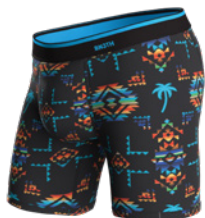
BEACH BLANKET BLACK