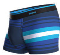
SUNDAY STRIPE BLUE