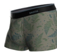
FERN GULLY PINE