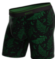
FERN GULLY GREEN