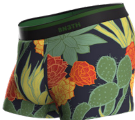
DESERT BLOOM DARK NAVY