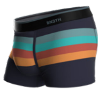
RETRO STRIPE DARK NAVY