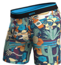
BUENOS DIAS NAVY