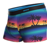
HORIZON PLAYA MULTI